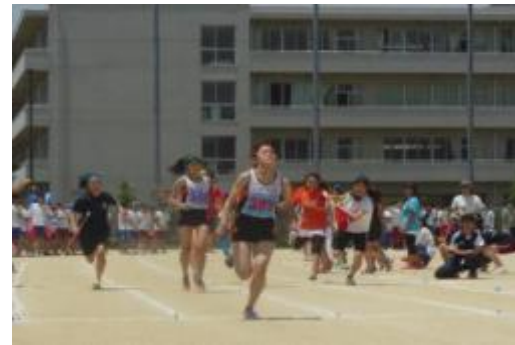
①陸上部 ②ソフトテニス部 ③バトン部 ④硬式テニス部