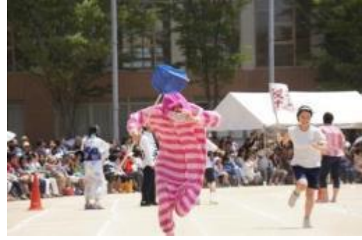
①生物部 ②軽音部 ③茶道部 ④写真部 ⑤吹奏楽部 ⑥美術部