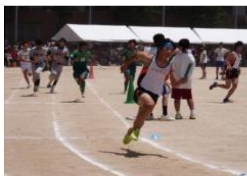
①陸上部 ②サッカー部 ③野球部 ④バスケット部 ⑤ソフトテニス部 ⑥水泳部